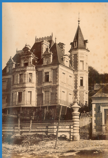
La Villa Montebello, un joyau balnéaire