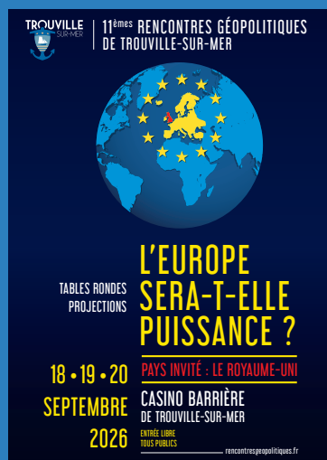
Les Rencontres Géopolitiques de Trouville-sur-Mer