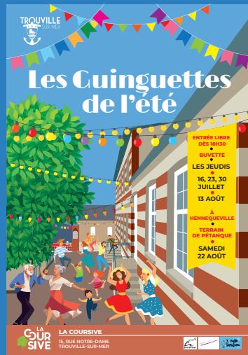
Les Guinguettes de l'été