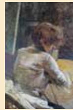
Henri de Toulouse-Lautrec : À Grenelle, huile sur toile, vers 1888, Sterling and Francine Clark Art Institute - Williamstown (Massachusetts).