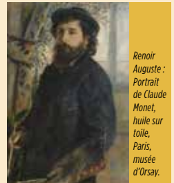
Renoir Auguste : Portrait de Claude Monet, huile sur toile, Paris, musée d'Orsay.

Conservateur en chef honoraire du Patrimoine, chargée de mission au Musée d'Orsay. Peignant le plus souvent en plein air, les impressionnistes se libèrent de l'académisme par l'emploi de couleurs claires et lumineuses posées en touches libres et rapides, dites en « virgule ». L'étude scientifique de leurs techniques, matériaux et pigments donne sa vraie place à l'Impressionnisme dans l'histoire de l'Art des années 1860 jusqu'à la fin du siècle. L'analyse de leurs palettes permet de mieux comprendre en quoi ce mouvement est une révolution de la couleur.