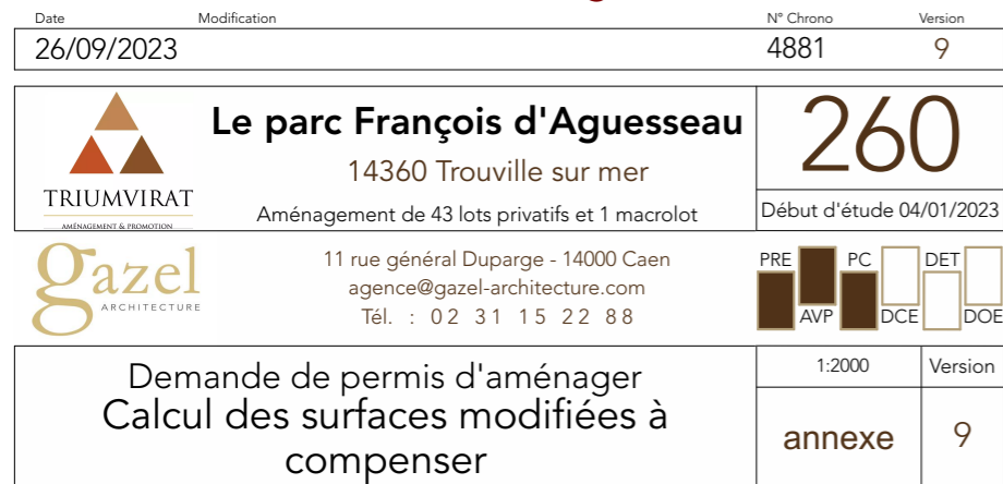
Plan masse - 2000°

Pièces complémentaires au PA 014 715 23 R0006